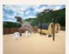
プールサイド広場