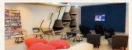
湯上り処(マッサージ・マンガ)