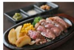
グレードUP ステーキ しゃぶしゃぶ