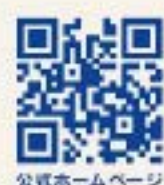
公式ホームページ

鳥栖JCTより約50分 久留米市より約1時間 福岡市より約1時間20分 大分市より約1時間20分 北九州市より約1時間40分 熊本市より約1時間40分