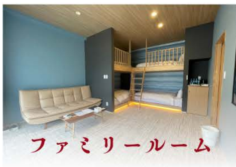
ファミリールーム