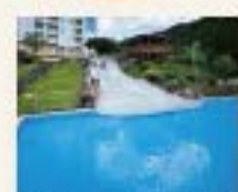
ととのいプール(夏)